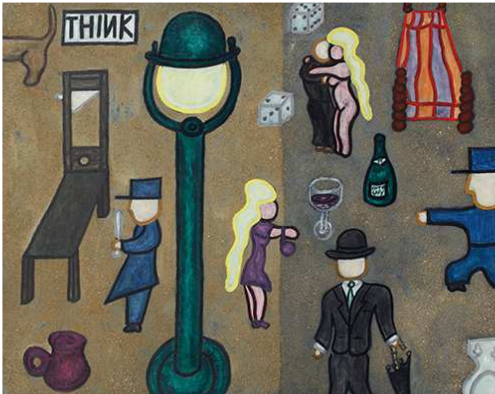
William N. Copley, Untitled (Think) , 1961, 63,5 x 80 cm © VG Bild-Kunst, Bonn 2020 / Olbricht Collection