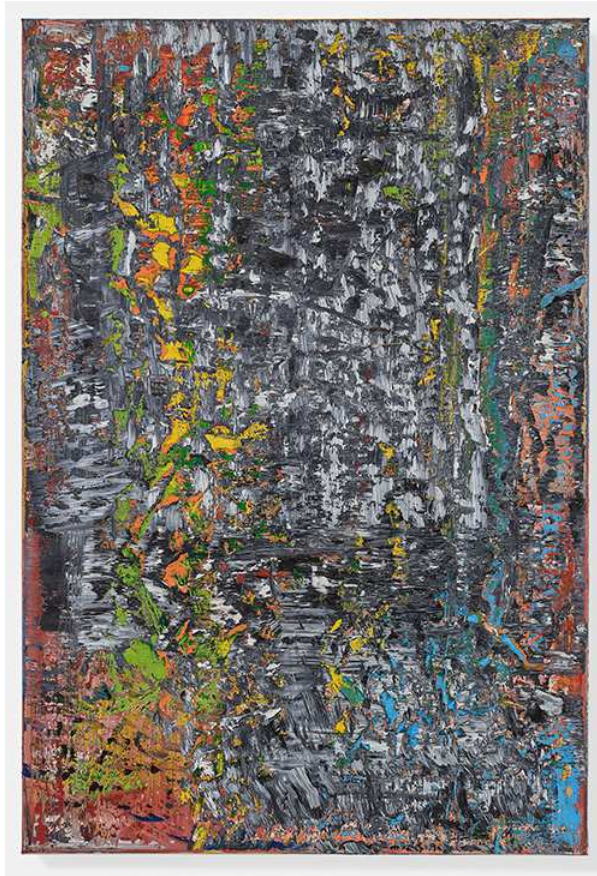
Gerhard Richter, Abstraktes Bild , 2017, 155 x 105 cm © Gerhard Richter 2019 (0247) / Olbricht Collection