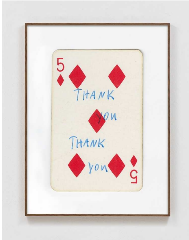
FORT, Symptoms Of The Universe , 2018