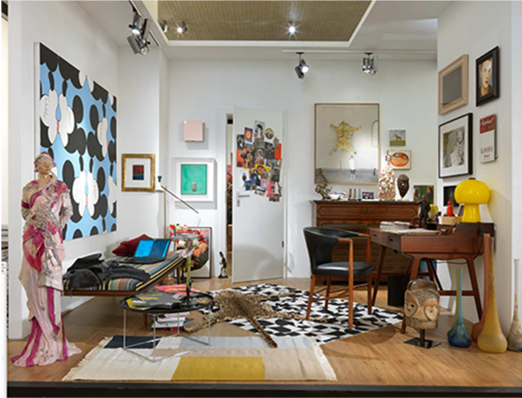
MOVING ENERGIES – 10 years me Collectors Room Berlin, Installationsansicht, installation view, 2020