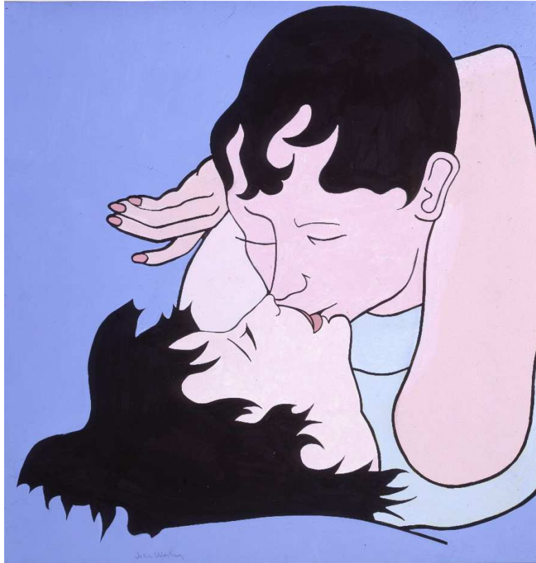
John Wesley, Untitled (Lautrec's bisou) , 2005, 48 x 46 cm © Courtesy of the artist and Fredericks & Freiser, NY / Olbricht Collection, Photo Achim Kukulies, Düsseldorf