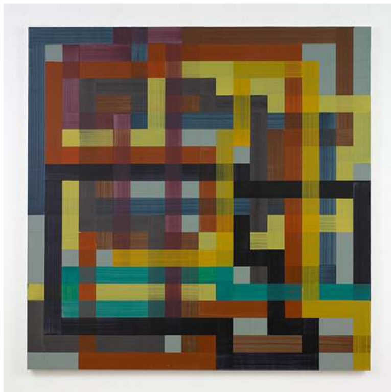
Bernard Frize, Blanc , 2006, 165 x 165 cm © Courtesy Perrotin, Bernard Frize / VG Bild-Kunst, Bonn 2020 / Olbricht Collection, Photo André Morin