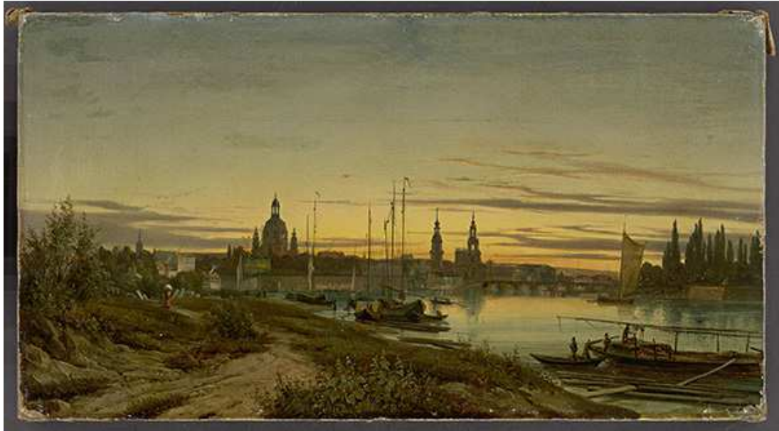
Anonym, Dresden im Abendlicht , um 1850/60, 24,5 x 45 cm