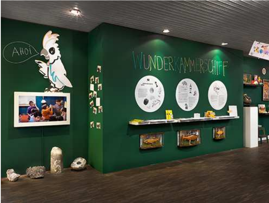
MOVING ENERGIES – 10 years me Collectors Room Berlin, Installationsansicht, installation view, (Kinderprogramm, Children's programme) 2020, Photo Bernd Borchardt