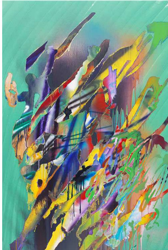
Katharina Grosse, o.T. 2014, 201 x 135 cm © VG Bild-Kunst, Bonn 2020 / Olbricht Collection