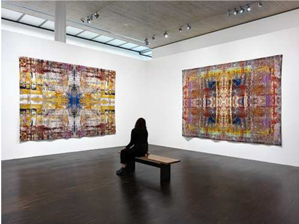
MOVING ENERGIES – 10 years me Collectors Room Berlin, Installationsansicht, installation view, (Gerhard Richter), 2020, Photo Bernd Borchardt