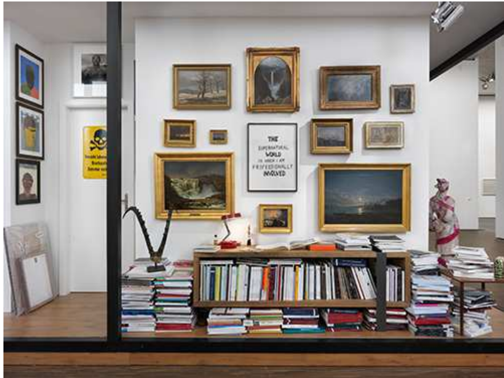
MOVING ENERGIES – 10 years me Collectors Room Berlin, Installationsansicht, installation view, 2020, Photo Bernd Borchardt