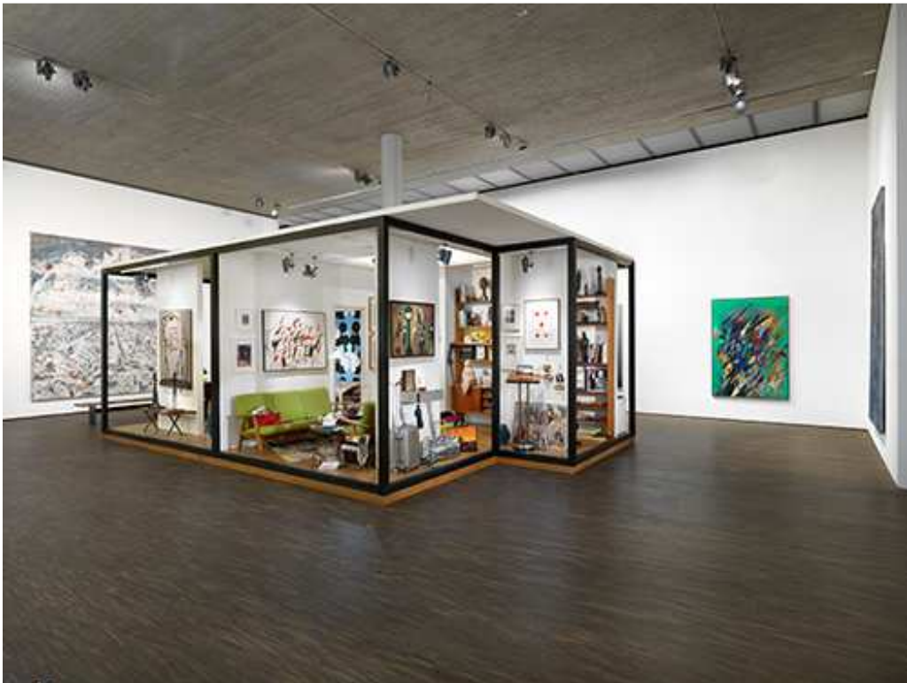
MOVING ENERGIES – 10 years me Collectors Room Berlin, Installationsansicht, installation view, 2020, Photo Bernd Borchardt