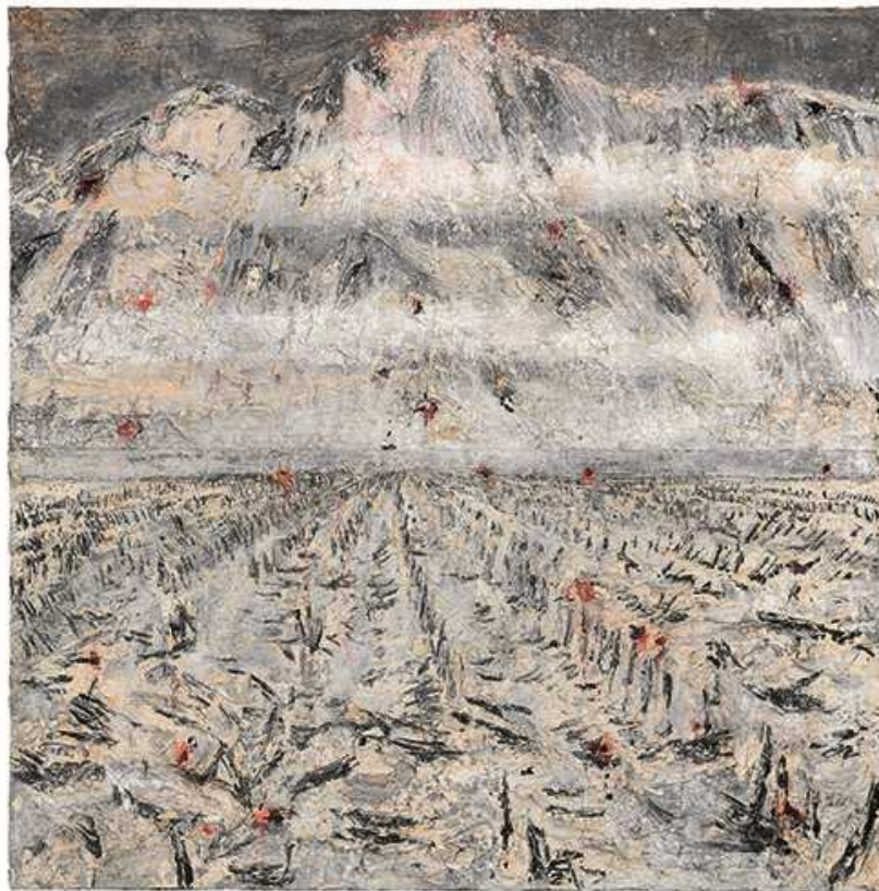
Anselm Kiefer, Wundtau regnet , 2011, 380 x 380 cm © Anselm Kiefer / Olbricht Collection