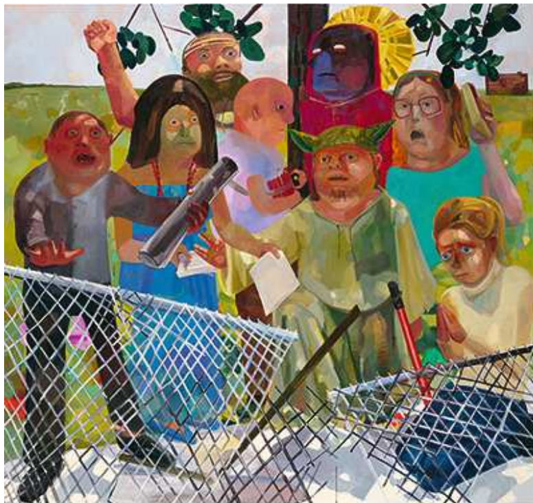
Dana Schutz, Fanatics , 2005, 229 x 244 cm © the artist, Courtesy Contemporary Fine Arts, Berlin and Petzel Gallery, New York / Olbricht Collection, Photo Jochen Littkemann