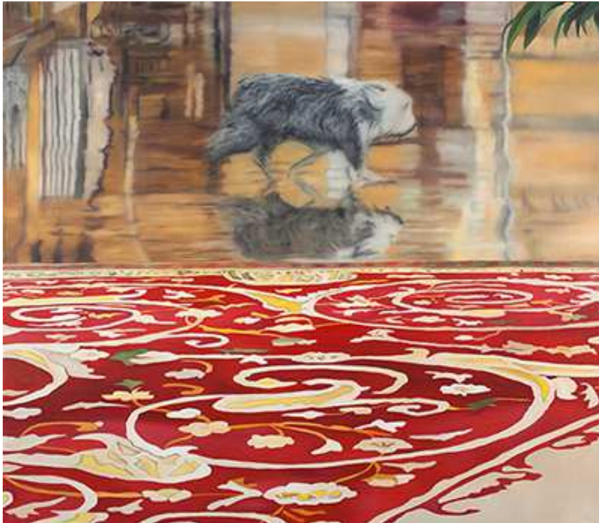
Karin Kneffel, Ohne Titel , 2005, 200 x 230 cm © VG Bild-Kunst, Bonn 2020 / Olbricht Collection