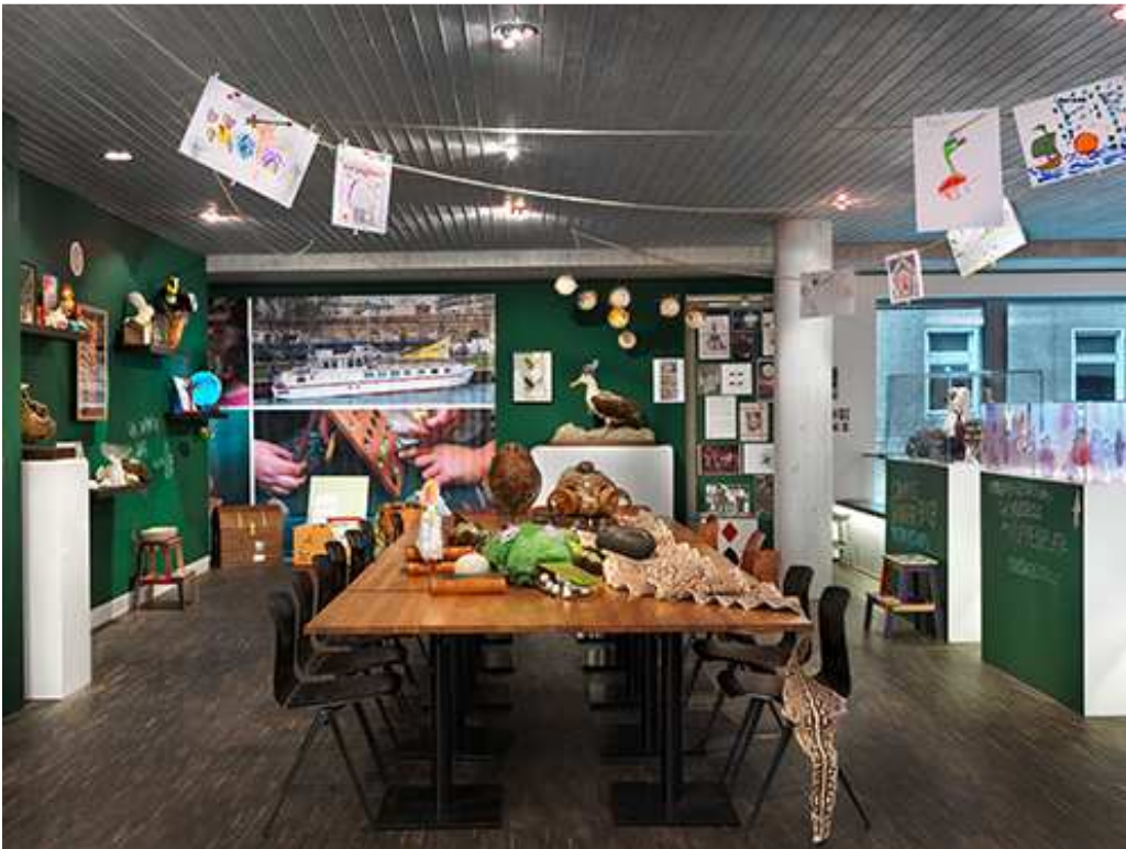
MOVING ENERGIES – 10 years me Collectors Room Berlin, Installationsansicht, installation view, (Kinderprogramm, Children's programme) 2020, Photo Bernd Borchardt