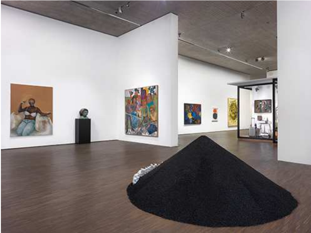
MOVING ENERGIES – 10 years me Collectors Room Berlin, Installationsansicht, installation view, 2020