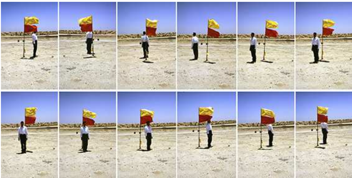
Mohammed Kazem, Fotografien mit einer Fahne, 1997, 12 C-Prints, je 42 x 27,22 cm.