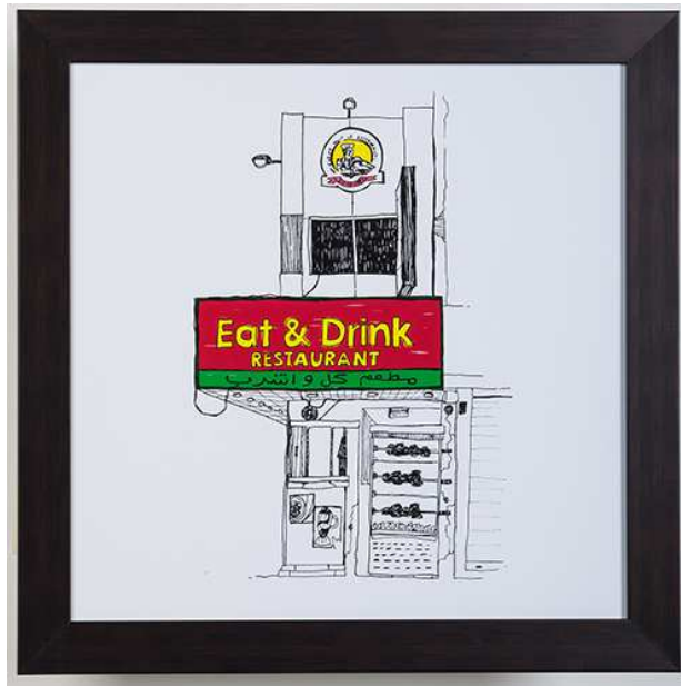
Khalid Mezaina, Cafeterien in den VAE, 2016, Bleistift und Reißfeder auf Kartuschenpapier, Farben digital hinzugefügt, 6 Illustrationen, je 50 x 50 cm. Eine Auftragsarbeit des Abu Dhabi Festivals 2016. Mit freundlicher Genehmigung des Künstlers. ADMAF Art Collection. © ADMAF

Khalid Mezaina, Cafeterias of the UAE, Pencil and drawing pen on cartridge paper, digitally coloured, 6 illustrations; each 50 x 50 cm. An Abu Dhabi Festival 2016 Commission. Courtesy of the artist. Part of the ADMAF Art Collection. © ADMAF