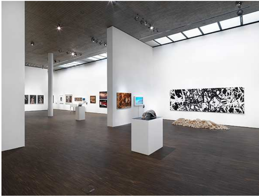
Portrait of a Nation: Zeitgenössische Kunst aus den Vereinigten Arabischen Emiraten, Mit Werken aus der ADMAF Art Collection, Installationsansicht im me Collectors Room Berlin, 2017