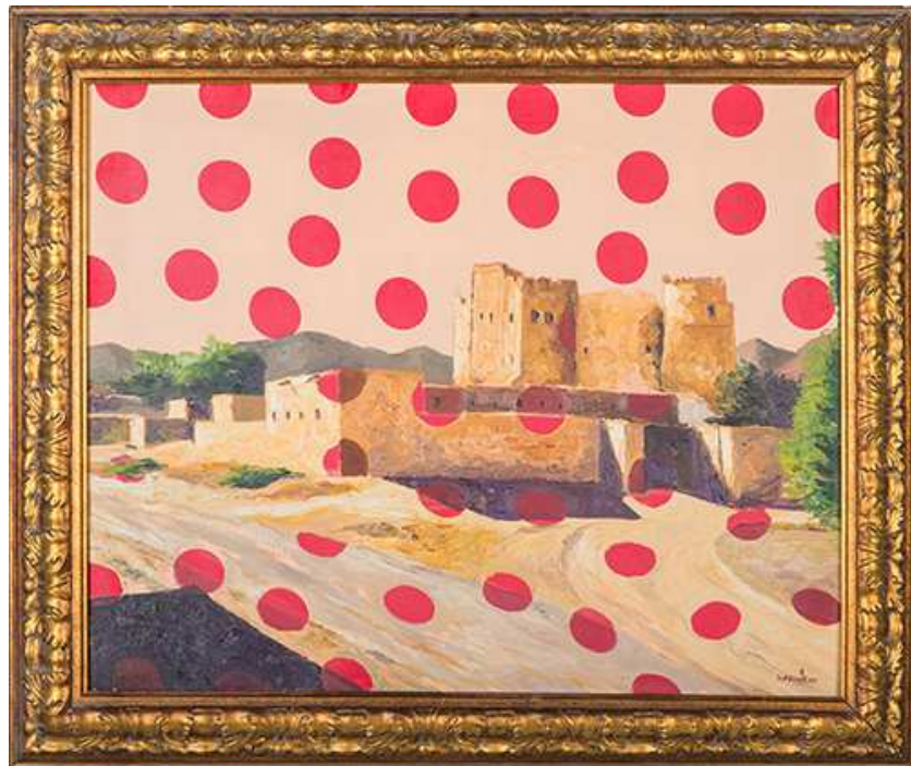
Obaid Suroor, Die Festung von Fujairah, 2007, Öl auf Leinwand, 65 x 79 cm. Mit freundlicher Genehmigung des Künstlers. ADMAF Art Collection. © ADMAF