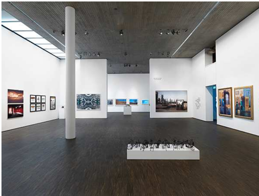
Portrait of a Nation: Zeitgenössische Kunst aus den Vereinigten Arabischen Emiraten, Mit Werken aus der ADMAF Art Collection, Installationsansicht im me Collectors Room Berlin, 2017