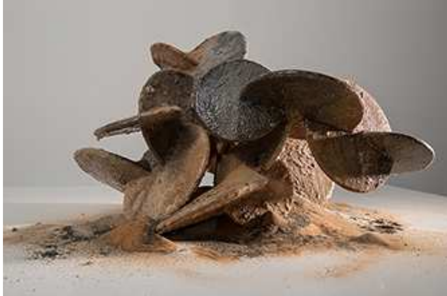
Sarah Al Agroobi, Die Wüstenrose, 2016, Harz und Sand der sieben Emirate, 45 x 60 x 45 cm. Eine Auftragsarbeit des Abu Dhabi Festivals 2016. Mit freundlicher Genehmigung der Künstlerin. ADMAF Art Collection. © ADMAF