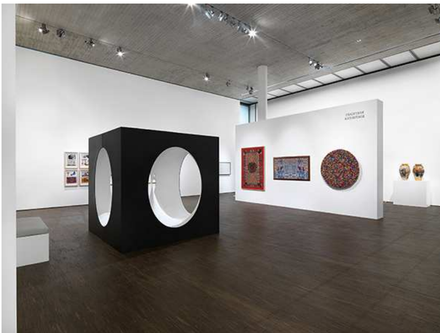
Portrait of a Nation: Zeitgenössische Kunst aus den Vereinigten Arabischen Emiraten, Mit Werken aus der ADMAF Art Collection, Installationsansicht im me Collectors Room Berlin, 2017