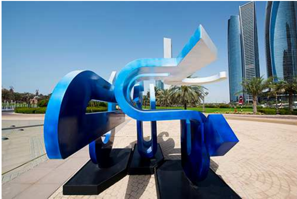
Azza Al Qubaisi, Dhad, 2016, verzinkter Stahl mit Farbbeschichtung, 250 x 300 x 150 cm. Eine Auftragsarbeit des Abu Dhabi Festivals 2016. ADMAF Art Collection.