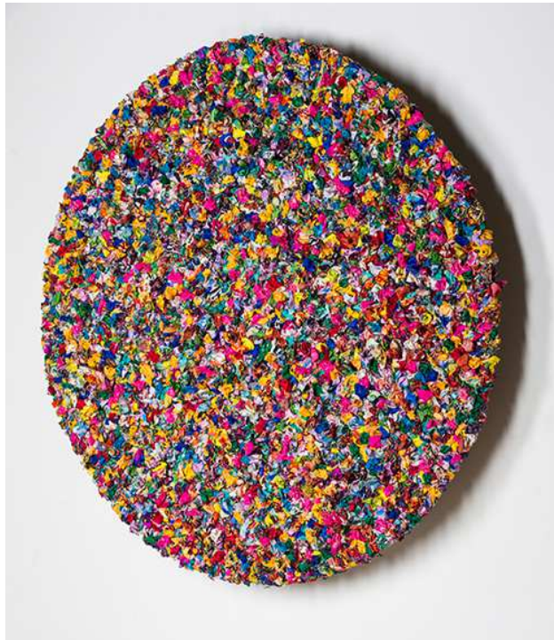
Khalid Al Banna, Kreislauf des Wandels, 2016, Stoffcollage, Durchmesser 130 cm. Eine Auftragsarbeit des Abu Dhabi Festivals 2016. Mit freundlicher Genehmigung des Künstlers. ADMAF Art Collection. © ADMAF