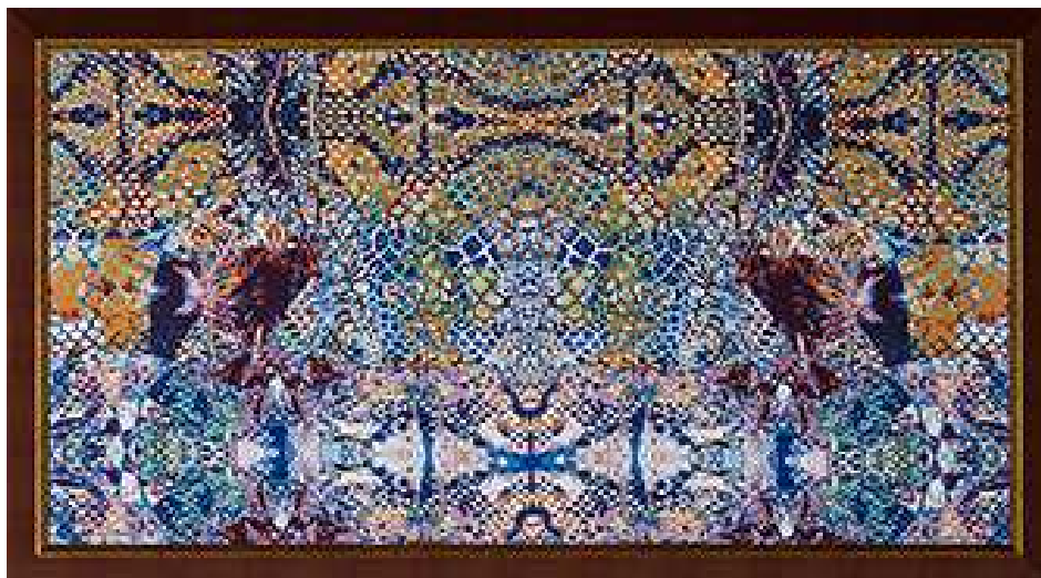
Saeed Al Madani, Arabische Oryxantilope, 2016, Pigmenttinte und Siebdruck auf Gewebe. Eine Auftragsarbeit des Abu Dhabi Festivals 2016. Mit freundlicher Genehmigung des Künstlers. ADMAF Art Collection. © ADMAF