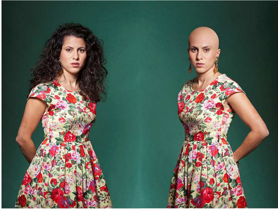
Lamya Gargash, Diana, 2012, aus der Serie ‚Im Spiegel‘, Diptychon C-Print, je 114 x 76 cm. Mit freundlicher Genehmigung der Künstlerin und der Galerie The Third Line