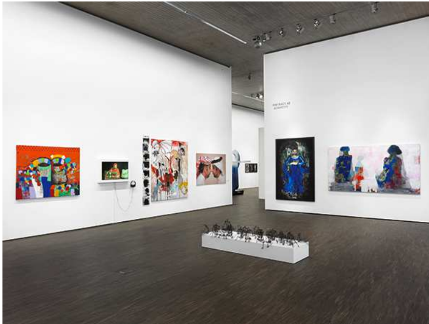
Portrait of a Nation: Zeitgenössische Kunst aus den Vereinigten Arabischen Emiraten, Mit Werken aus der ADMAF Art Collection, Installationsansicht im me Collectors Room Berlin, 2017