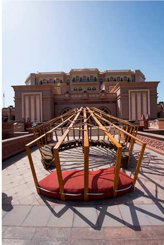
Khalid Shafar, DER NOMADE, 2015, Afrikanisches Teakholz, 500 x 600 x 280 cm. Mit Unterstützung des Dubai Design District (d3) und des Abu Dhabi Festivals. Mit freundlicher Genehmigung des Designers @khalidshafar