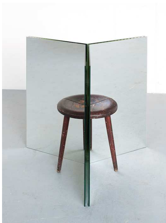
Alicja Kwade, Ein Hocker ist ein Bild , 2015, Spiegel, Hocker / Mirrors, stool, Courtesy Alicja Kwade and KÖNIG GALERIE, Photo Roman März