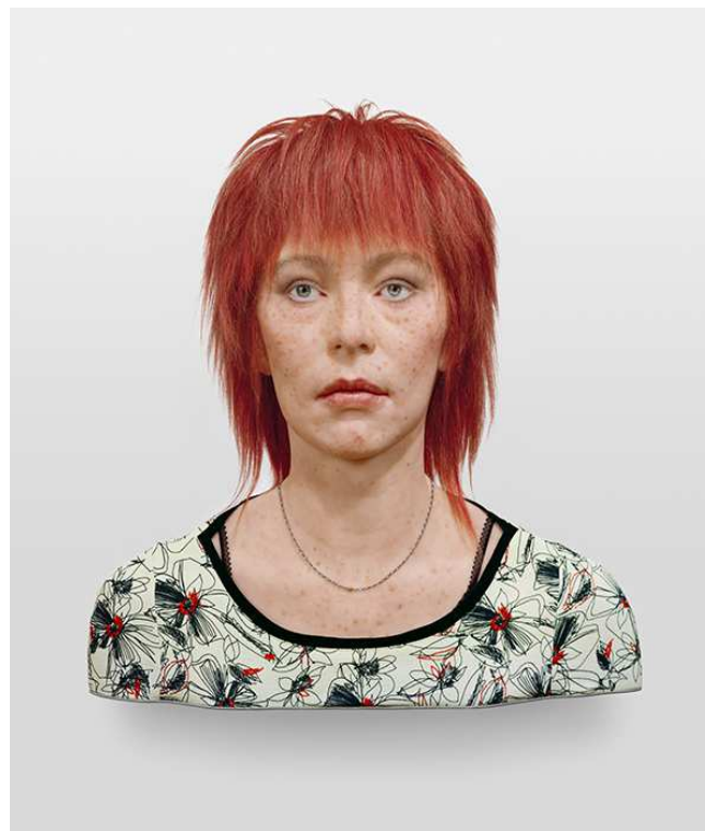
Evan Penny, No one - in particular # 15, Series 1 , 2005, Silikon, Pigment, Haar, Stoff, Aluminium / Silicone, pigment, hair, fabric, aluminium