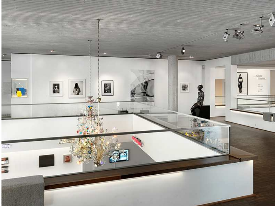
Private Exposure, Installationsansicht, installation view, 2016