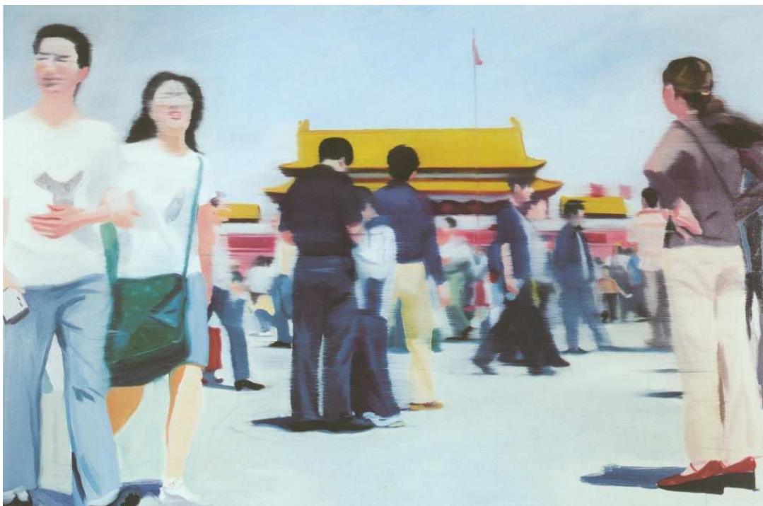
Jian Zhang, Square Nr. 3 , 2005, Öl auf Leinwand / Oil on canvas