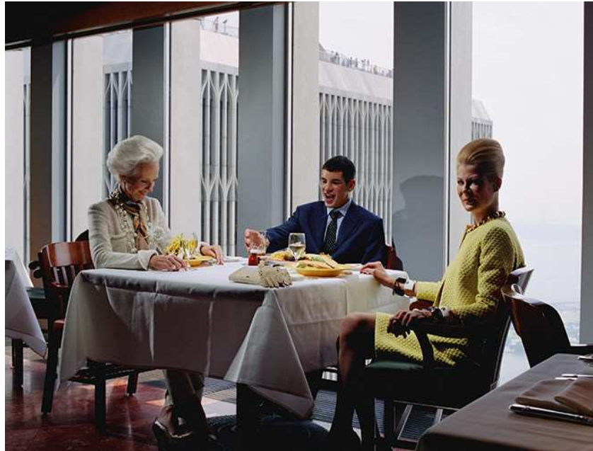
Philip-Lorca diCorcia, W, September 2000, #6 , 2000, Pigmentdruck / Archival pigment print, Courtesy the artist and David Zwirner, New York/London