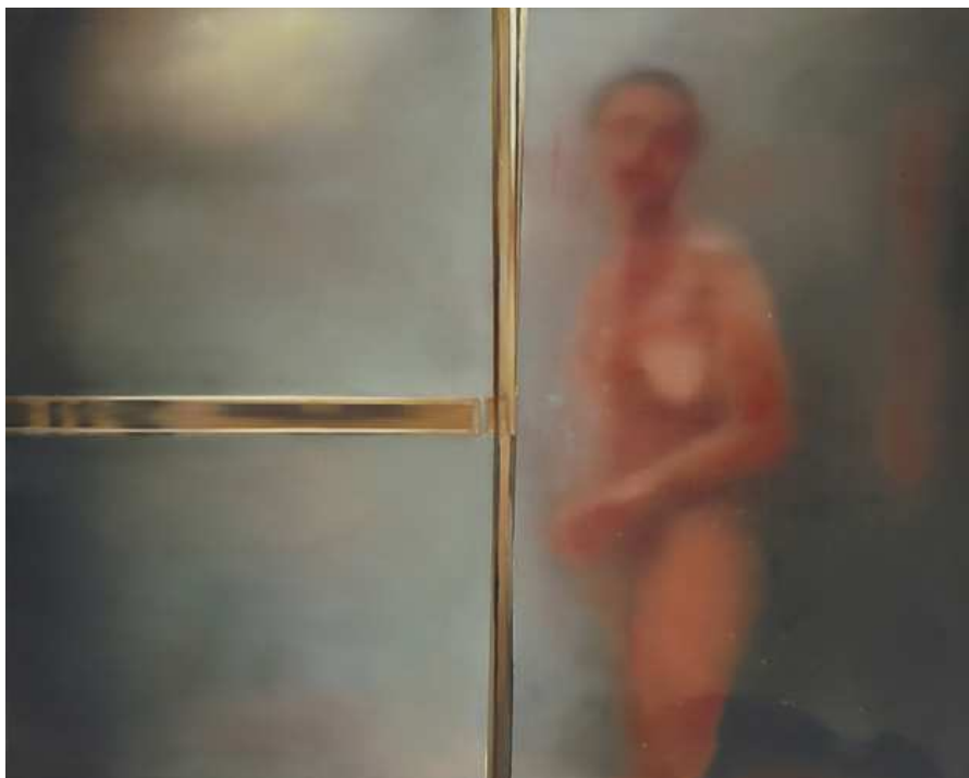
Johannes Kahrs, Untitled (shower LA) , 2005, Öl auf Leinwand / Oil on canvas