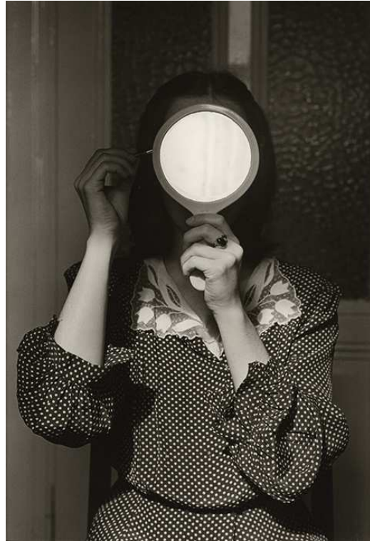
André Gelpke, Christine mit Spiegel , 1977, Silbergelatineabzug / Gelatin silver print