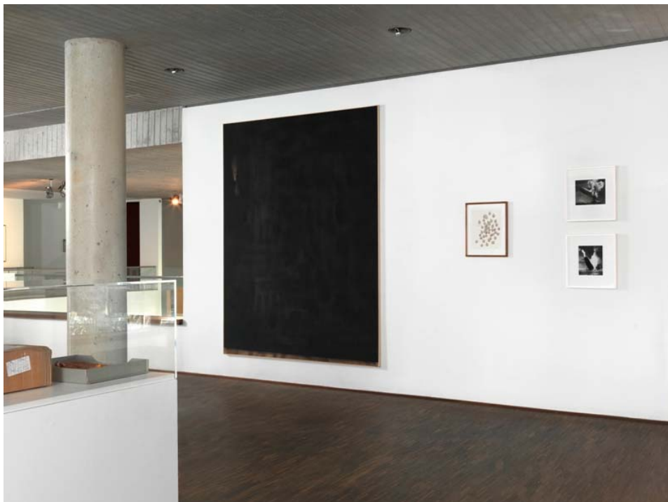
Falling Fictions, Installationsansicht, installation view