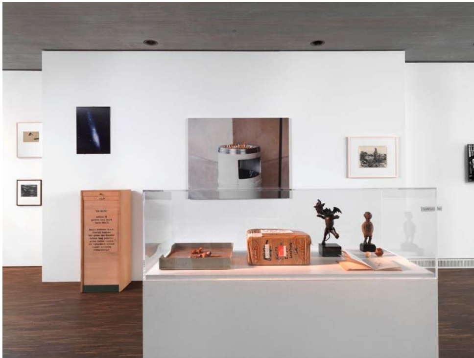
Falling Fictions, Installationsansicht, installation view