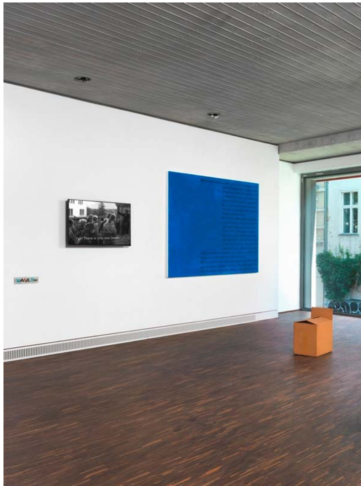
Falling Fictions, Installationsansicht, installation view © me Collectors Room Berlin; Photo Bernd Borchardt