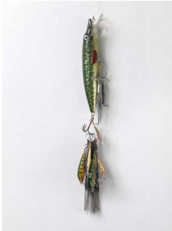
Claire Fontaine, Passe-Partout , 2008 © Courtesy of the artist and Metro Pictures, New York