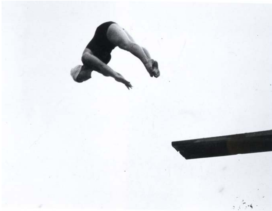
Anonym, Ohne Titel (Turmspringerin), um, around 1930