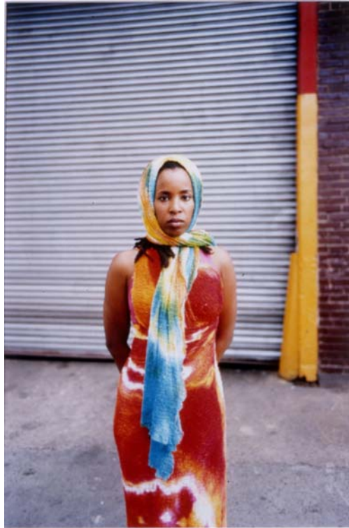
Jitka Hanzlová, Jaqueline, Chelsea, aus der Serie / from the series „Female“ 1999, Farbfotografie / colour print, 28,8 x 19,2 cm