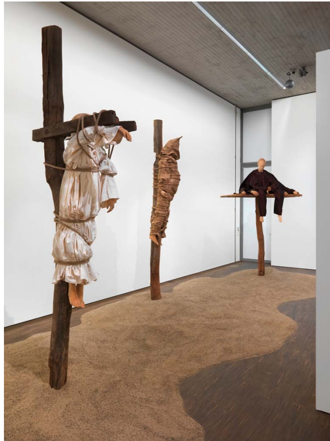
Queensize - Female Artists from the Olbricht Collection, Installationsansicht / installation view