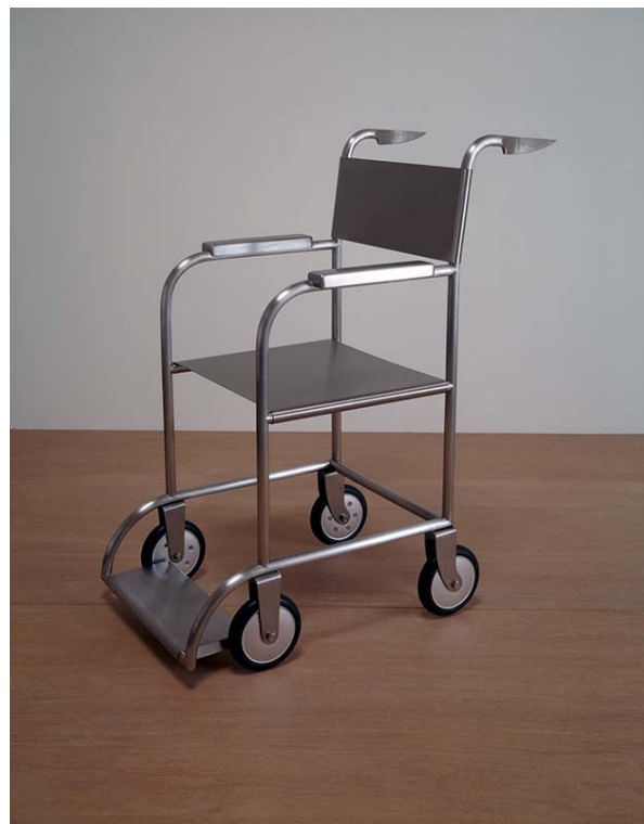
Mona Hatoum, Untitled (wheelchair) , 1998, Rostfreier Edelstahl und Gummi / Stainless steel and rubber, 97 x 50 x 84 cm © Mona Hatoum, Photo Edward Woodman, Courtesy White Cube