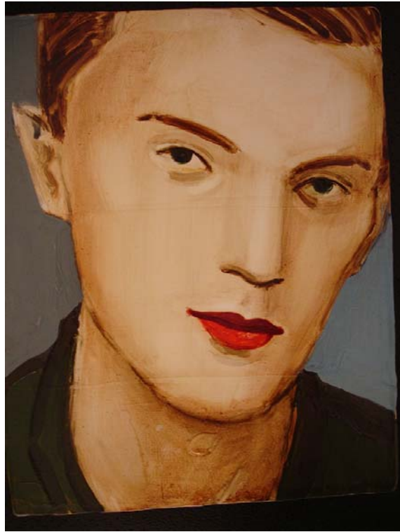
Elizabeth Peyton, Paul Peyton (Dad), 1995, Öl auf Leinwand / Oil on canvas, 25,5 x 20,5 cm © Elizabeth Peyton