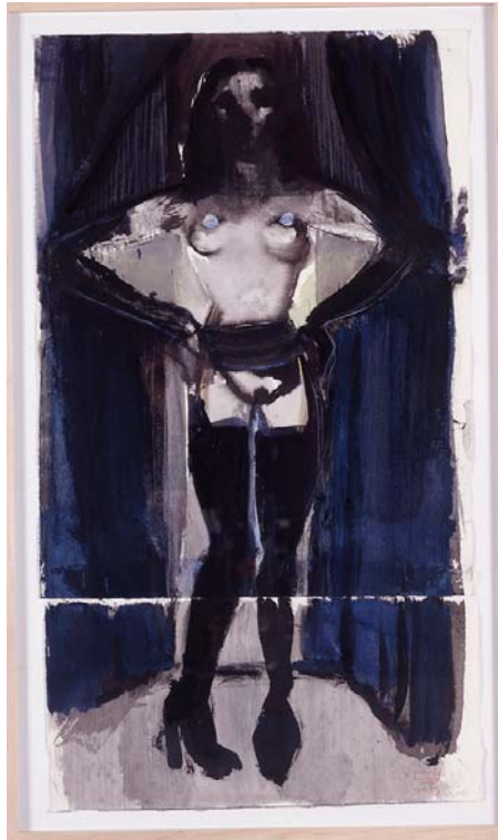
Marlene Dumas, Nobody's baby , 2000, Tusche, metallisches Acryl, Wachskreide auf Papier / Ink, metallic acrylic, crayon, pastel on paper, 61 x 38 cm