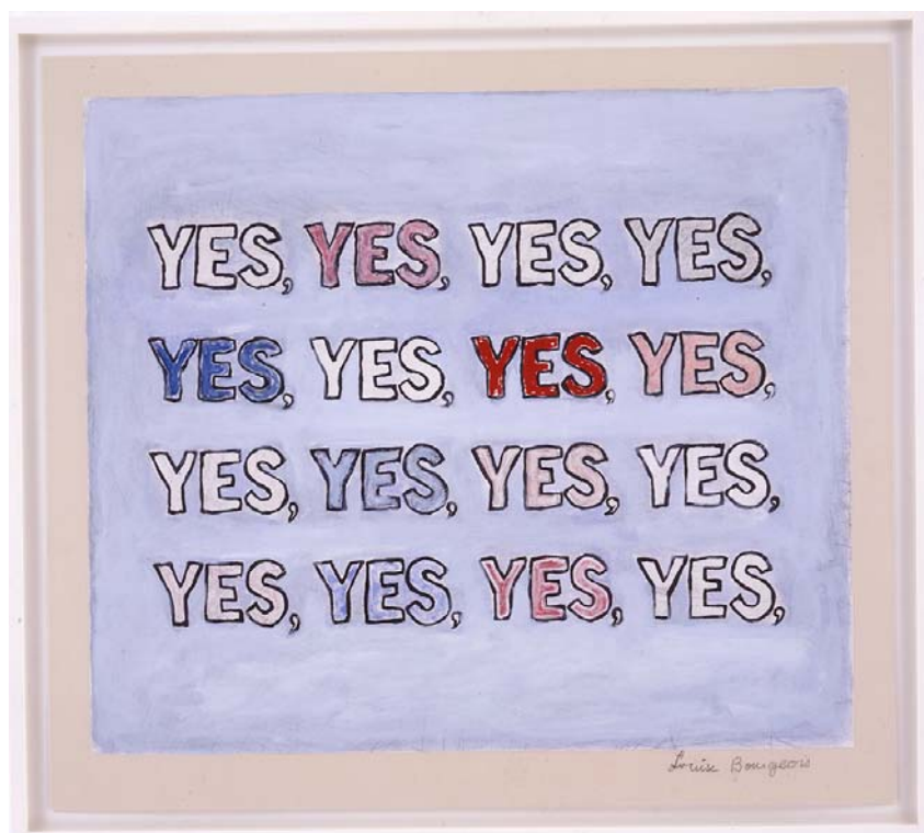
Louise Bourgeois, YES, 2004, Wasserfarben, Gouache, Tinte, farbige Tinte und Zeichnung auf Somerset Seidenpapier, montiert auf 'Twinrocker' / watercolour, gouache, ink, coloured ink and etching on Somerset Satin paper, mounted on Twinrocker, 69,8 x 77,8 cm © The Easton Foundation / VG Bild-Kunst, Bonn 2014