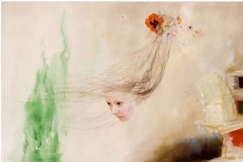
Monika Baer, Ohne Titel, 2004, Acryl, Aquarell, Öl auf Nessel / Acrylic, watercolour, oil on cotton, 180 x 280 cm © the artist and Galerie Barbara Weiss, Berlin