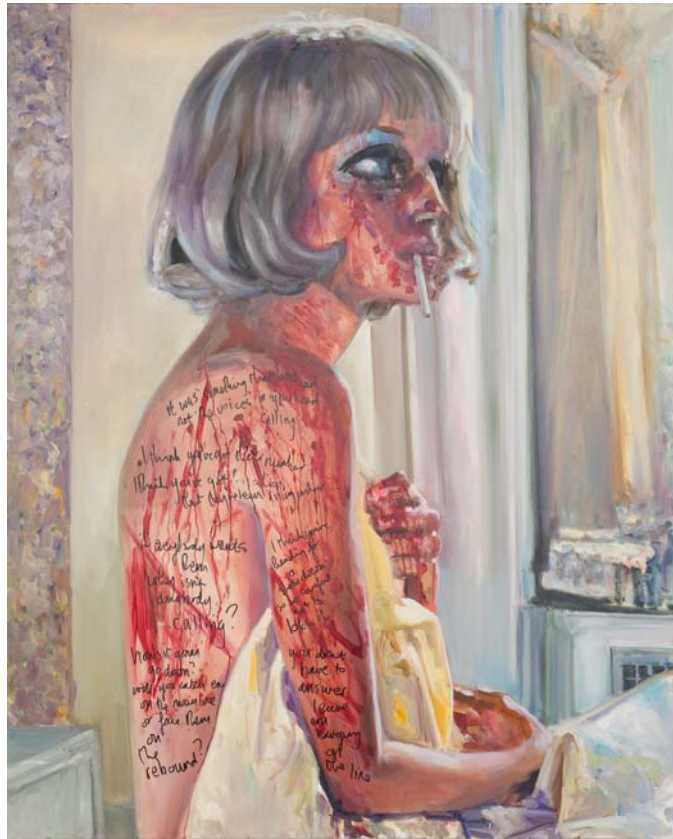
Dawn Mellor, Mia Farrow, 2010, Öl auf Leinwand / Oil on canvas, 152 x 122 cm © Dawn Mellor, Photo Jana Ebert