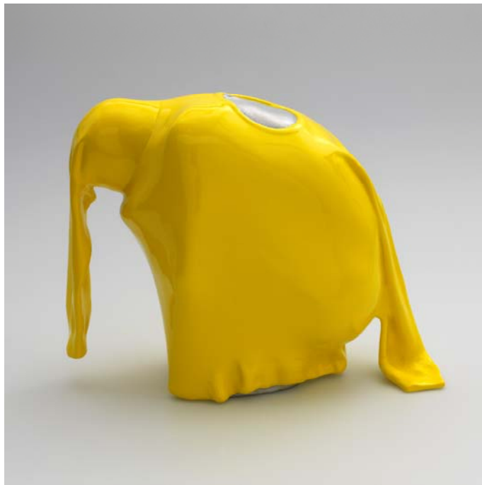
Erwin Wurm, man hiding in pullover (59 Stellungen), 2011, Aluminiumguss lackiert / Lacquered aluminium casting, 32 × 14 × 25 cm, Edition 15