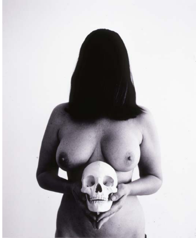
Marina Abramović, Self portrait with skull , 2005, S/W Fotografie / b/w photograph, 50 × 60 cm