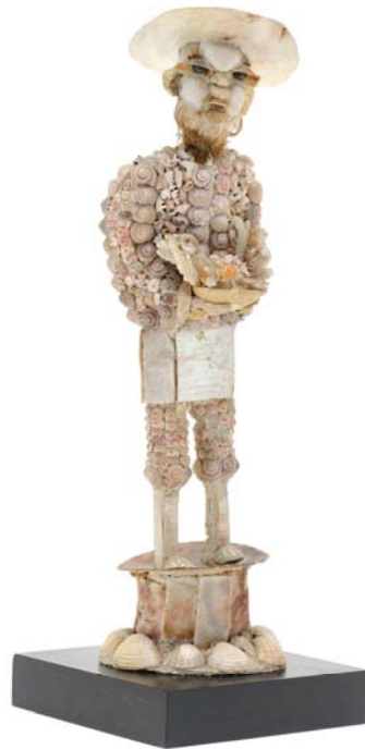
Muschelmann / Man made out of seashells , Deutsch, 18. Jh. / German, 18th century