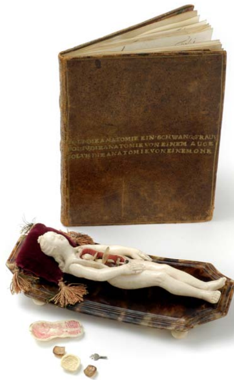
Stephan Zick, Anatomisches Lehrmodell einer schwangeren Frau mit Original Begleitbuch / Anatomical teaching model of a pregnant woman with original accompanying book , Nürnberg, um 1680 / Nuremberg, around 1680, Elfenbein, Schildpatt, Samt, Pergament / Ivory, tortoise shell, velvet, vellum, 15,5 cm