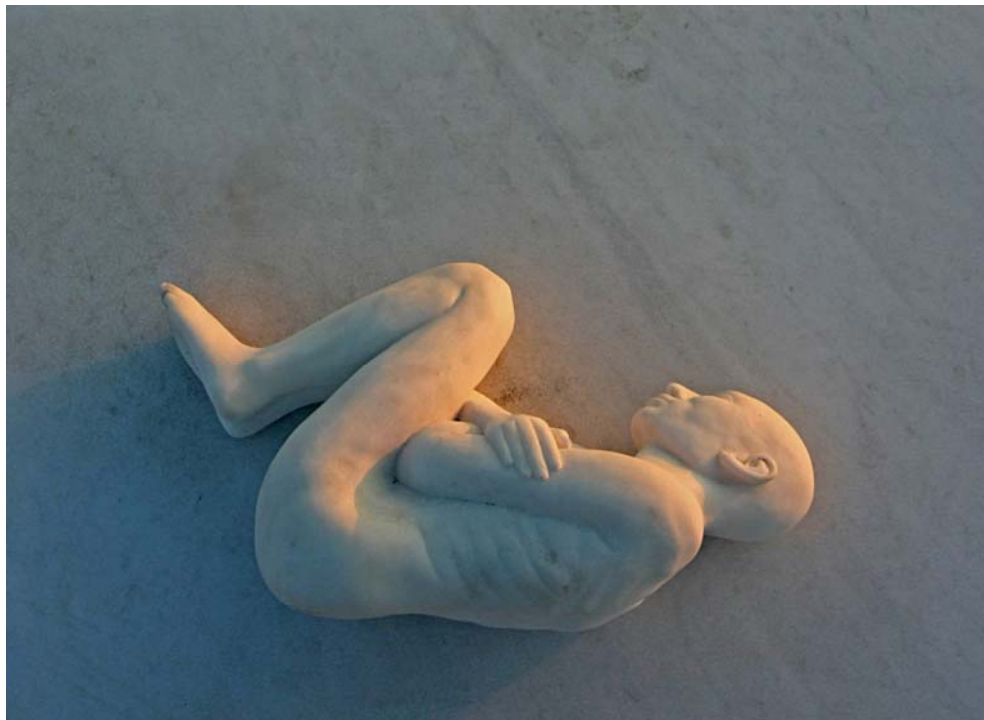
Terence Koh, Boy by the Roman Sea , 2010, Marmor / Marble, 40 × 90 × 55 cm