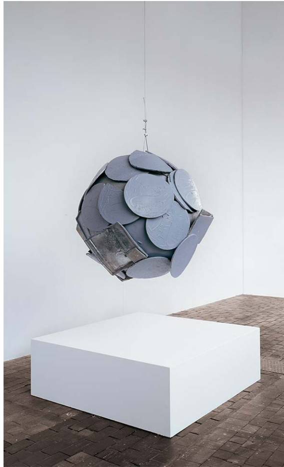
Thomas Scheibitz, Ohne Titel (Kugel), 2002 © VG Bild-Kunst, Bonn 2016, Photo Illmari Kalkkinen