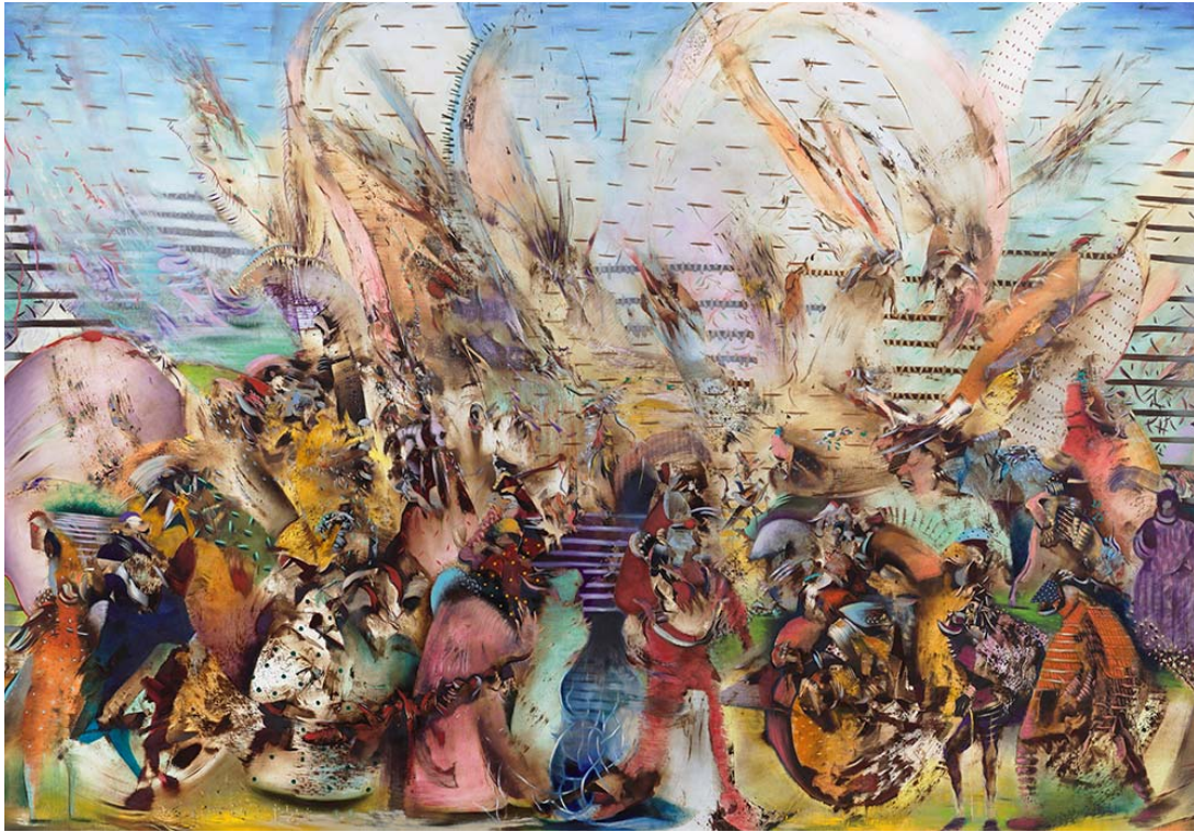
Ali Banisadr, Foreign Lands , 2015 © Ali Banisadr, Courtesy Galerie Thaddaeus Ropac, Paris Salzburg, Photo Charles Duprat