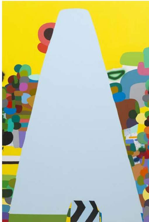
Federico Herrero, Blue Mountain, 2008, Courtesy the artist; Sies+ Höke, Düsseldorf, Photo Achim Kukulies, Düsseldorf