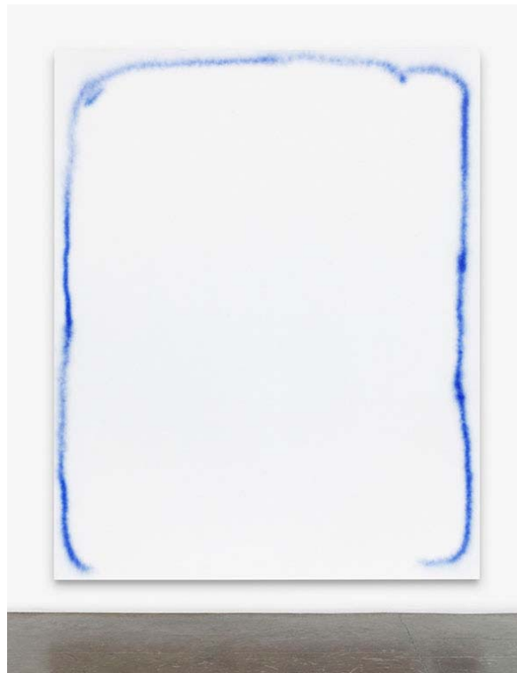
David Ostrowski, F (A thing is a thing in a whole which it`s not) © David Ostrowski, Courtesy Peres Projects, Berlin, Photo Hans-Georg Gaul