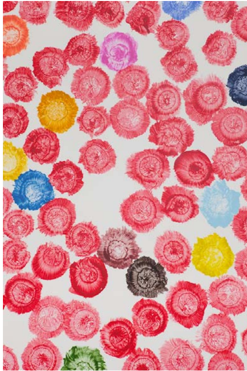
Bernard Frize, Puxo, 2011 © VG Bild-Kunst, Bonn 2016