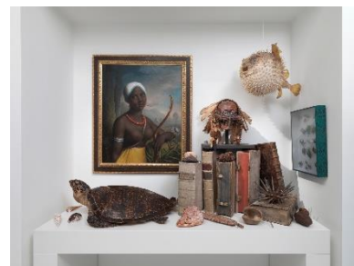
Wunderkammer Olbricht, Installationsansichten